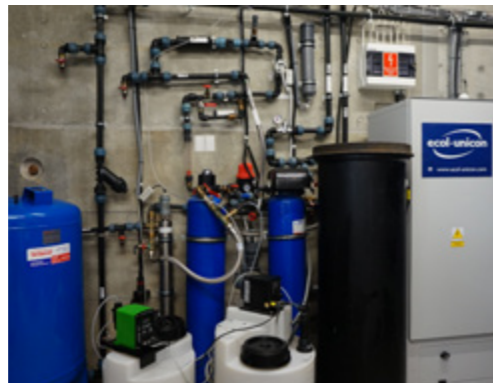
Moduł oczyszczania ścieków bytowych ECOL-UNICON