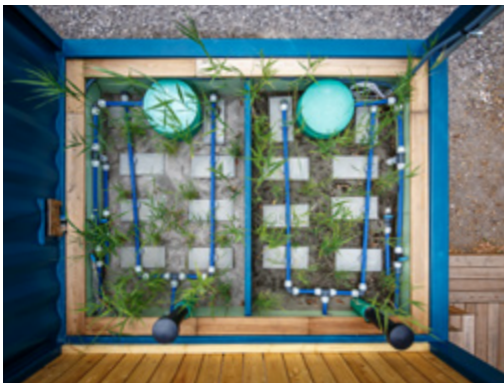
Kontenerowa oczyszczalnia hydrofitowa